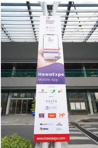
Outdoor Banner 1x5m