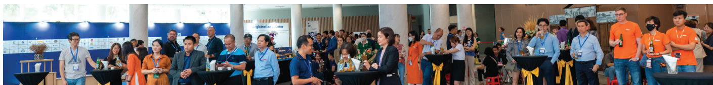
Event Center Lobby