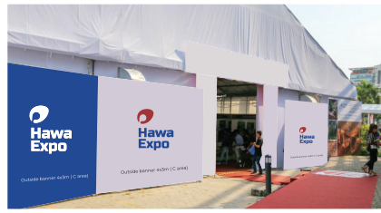
Outside banner C area (4mx3m)