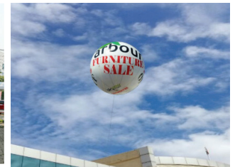
Balloon (size 3m)