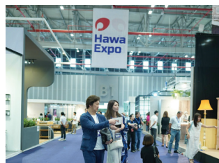
Indoor Banner 3x5m